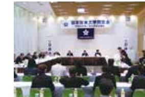
全体会 / 事業報告等