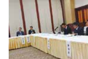
全体会 / 研究協議