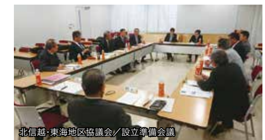
北信越・東海地区協議会 / 設立準備会議