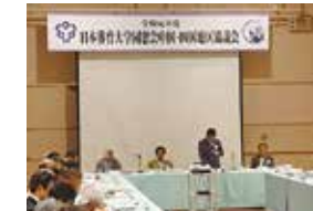
全体会 / 近況報告 具志堅学長