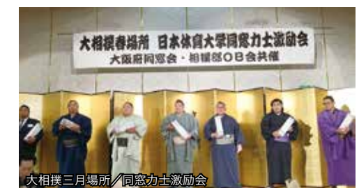
大相撲三月場所 / 同窓力士激励会