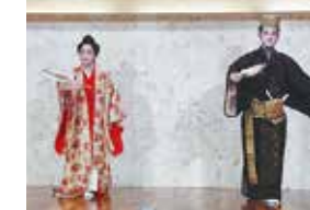
懇親会 / 伝統芸能 地元同窓