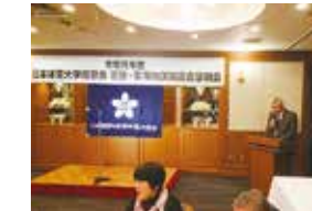
懇親会 / 歓談の様子