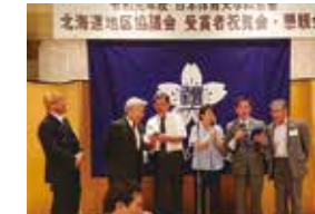
懇親会 / 余興の様子